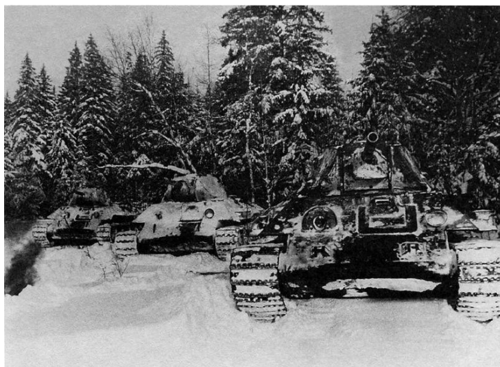
Танки Т-34 32-й танковой бригады перед атакой под Тулой.